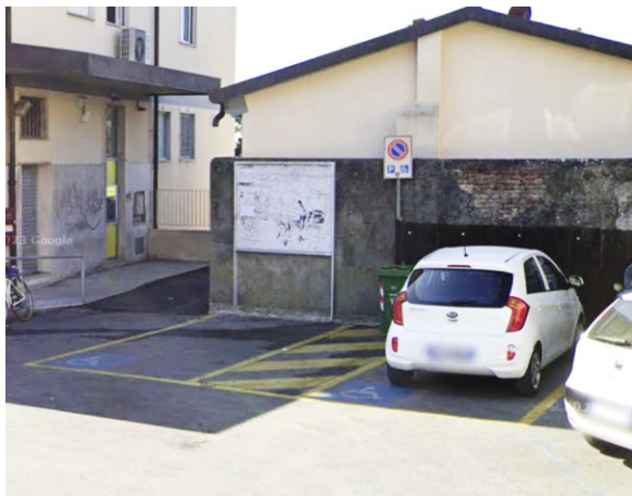
Parcheggi in Piazza della Repubblica