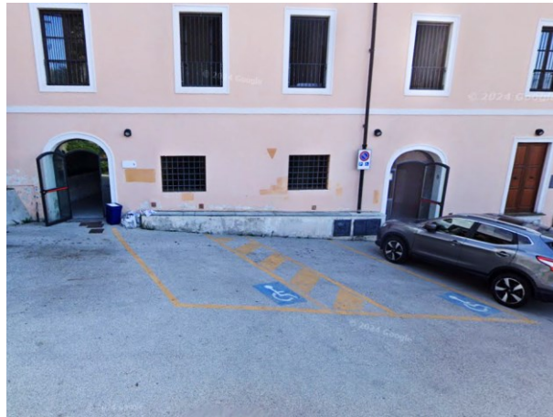
Parcheggi in via della Rocca